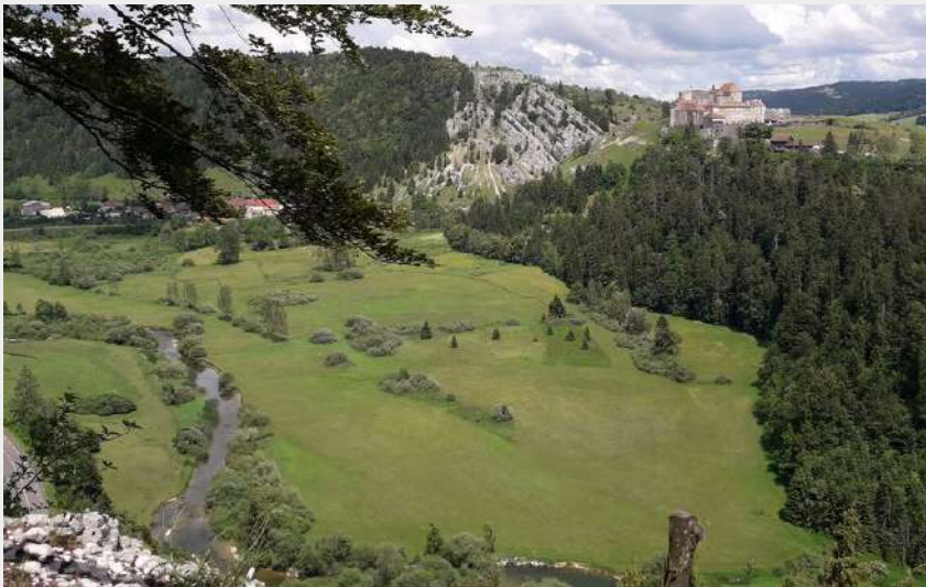
Belvédère des Granges (CCGP)