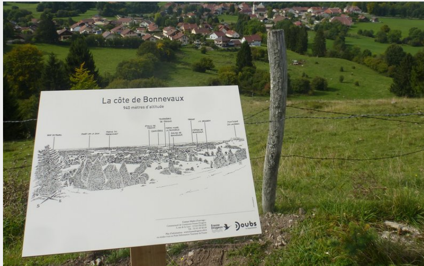
Vue du village de Bonnevaux