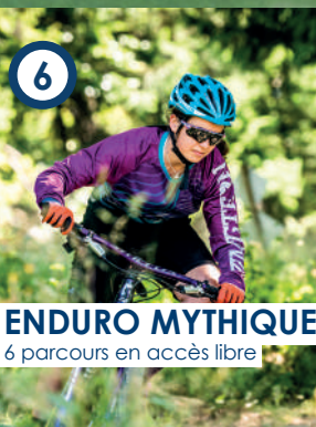
ENDURO MYTHIQUE 6 parcours en accès libre