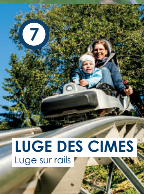
LUGE DES CIMES Luge sur rails