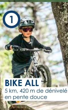
BIKE ALL 5 km, 420 m de dénivelé en pente douce

Ces protections peuvent se trouver en location chez les loueurs de la station.