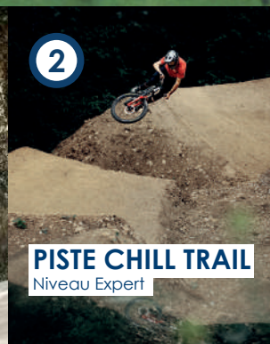
PISTE CHILL TRAIL Niveau Expert