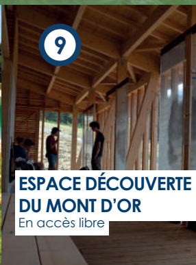
ESPACE DÉCOUVERTE DU MONT D'OR En accès libre