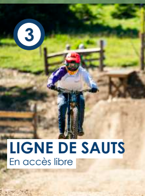
LIGNE DE SAUTS En accès libre