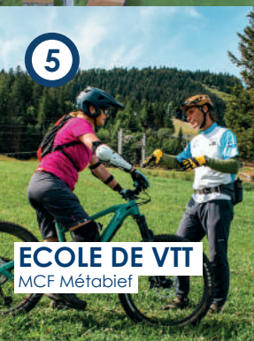
ECOLE DE VTT MCF Métabief