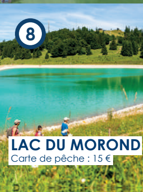
LAC DU MOROND Carte de pêche : 15 €