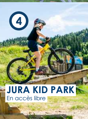
JURA KID PARK En accès libre